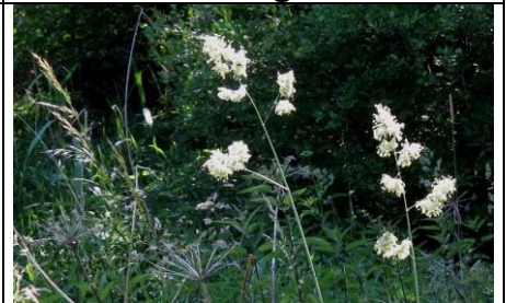
Wiesen- Knäuel gras