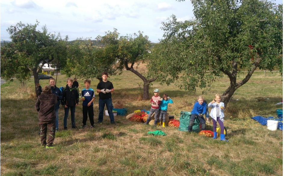
Wieder ein tolles Team, gut so, denn es gab sehr viele Äpfel 2018.

September: Im Herbst stand eine sehr beliebte Aktion auf dem Terminplan: die Apfelaktion. Erst wurde fleißig gesammelt und dann gemeinsam gepresst! Oh, wie lecker war die Ausbeute aus so vielen verschiedenen Äpfeln.