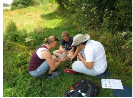
Auf den Auwiesen wird fotografiert, bestimmt, verglichen und gezählt.

Juli: Nachdem ich im Mai 2018 den ersten zaghaften Versuch gestartet habe, eine Jugendgruppe zu gründen, um mit ihnen andere, dem Alter angepasste, Aufgaben zu erledigen (wir waren mit unserem Förster im Wald, um den Neophyt, die spätblühende Traubenkirsche, zu schneiden), starteten ein paar wenige zum „Insektensommer“ durch. Hierbei sollten die gängigsten Insektenarten in einem Biotop bestimmt werden und gleich per Handy-App an den Landesverband geschickt werden.