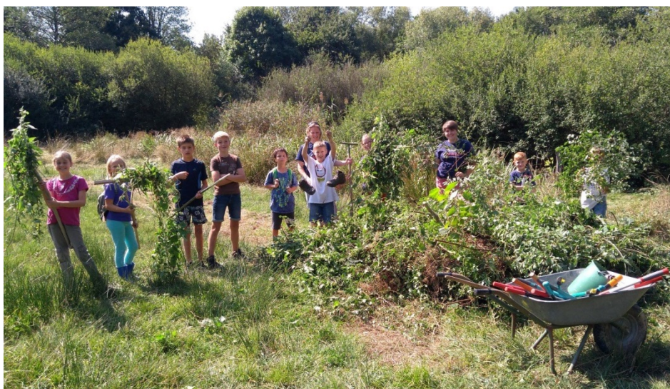
Große Dinge glücken im Team am besten.