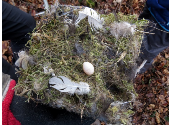
Das Nest einer Kohlmeise

Allerdings gilt das nur für die Beobachtungen der Waldvögel, nicht für unsere Feldvögel. Bei der Kontrolle im Wald hatten wir bei Kohl- und Blaumeisen ein relativ befriedigendes Ergebnis. Kleiber- und Trauerschnäpperbruten sind weiter rückläufig.