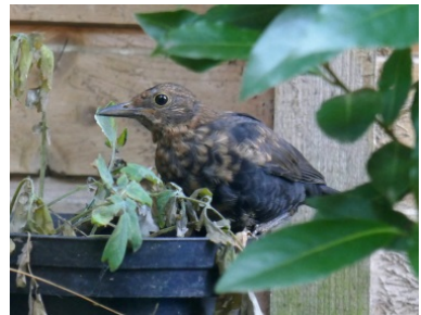
Es gibt aber noch viele gesunde Amseln: Dieser junge Vogel ist gerade ausgeflogen und erkundet im alten Wehrheimer Ortskern die Gegend.

Die starke Ausbreitung im Sommer 2018 lässt vermuten, dass die große Hitze einen sehr starken Effekt auf die Virusverbreitung hatte. Viele Amseln starben durch den Kontakt mit infizierten Artgenossen. Typische Anzeichen für betroffene Vögel sind, wenn sie apathisch wirken und nicht wegfliegen, wenn man näher kommt. Außerdem haben sie ein zerzaustes Gefieder.