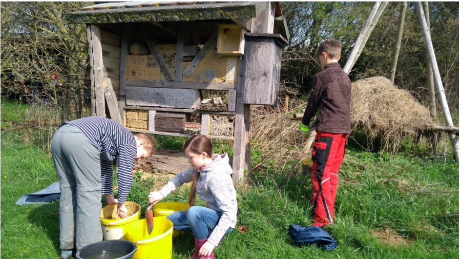
Die sonnige Nistwand für Wildbienen und Schlupfwespen wird erweitert und freigelegt. Eine schön matschige Angelegenheit.