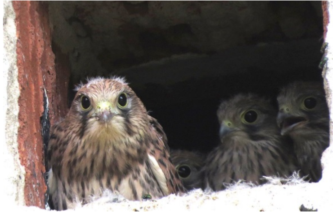
Die vier jungen „Ried-Falken“ kurz vor dem Ausfliegen 2018

Die Turmfalken brüeten wieder im Turm der evangelischen Kirche (3 Jungvögel). Im Haus von Wolf-Dieter Herrmann zog ein Turmfalkenpaar vier Junge groß. Die Kinderstube wurde wieder von einer installierten Webcam festgehalten.