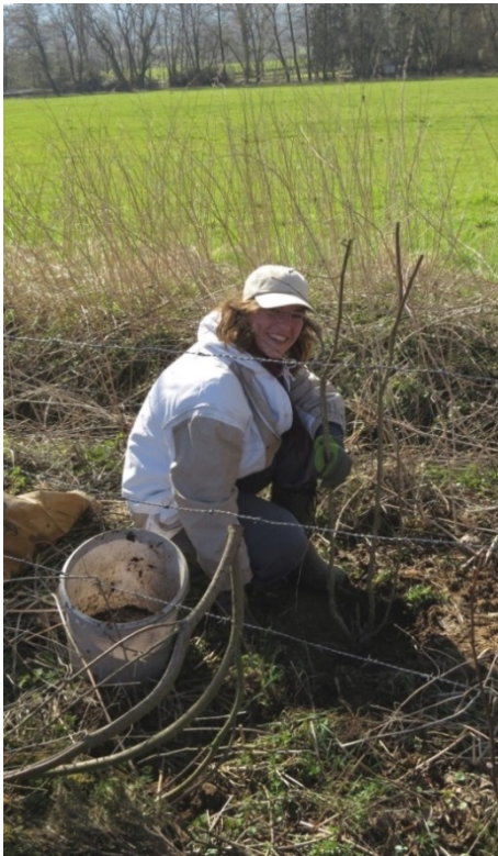
Neupflanzungen wurden vorgenommen...