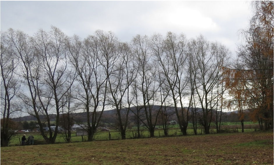
Feldgehölz Wolfskehl im November 2017: Aus 15 hochgewachsenen Weiden sollen Kopfweiden werden. Hier ein Bild kurz vor dem Schnitt.

Der Wert der Kopfweiden steigt mit ihrem Alter. Deshalb widmen wir uns besonders der Erhaltung dieser Bäume und ihrer Biotope. Da die wirtschaftliche Notwendigkeit zur Erhaltung der Kopfweiden (Rohmaterial für Korbflechter sowie Brennmaterialgewinnung) heute entfallen ist, sind diese stark gefährdet und ihre Pflege und Erhaltung sowie Neuanpflanzung von großem ökologischem Wert. Kopfweiden bilden nicht nur Lebensräume für Insekten und Höhlenbrüter, sondern sie sind auch ein kulturhistorisch landschaftsprägendes Element.