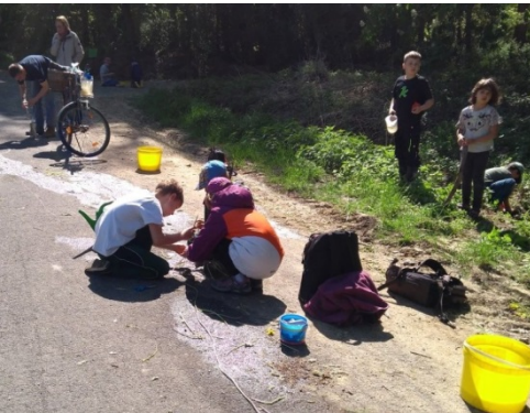
Hier wird gesteckt und geflickt...