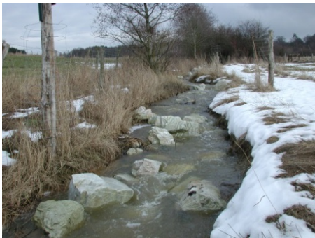
Wo früher das Wasser geradlinig und schnell Richtung Ortsmitte floss, wird es heute durch Mäander und „Störsteine“ ausgebremst.