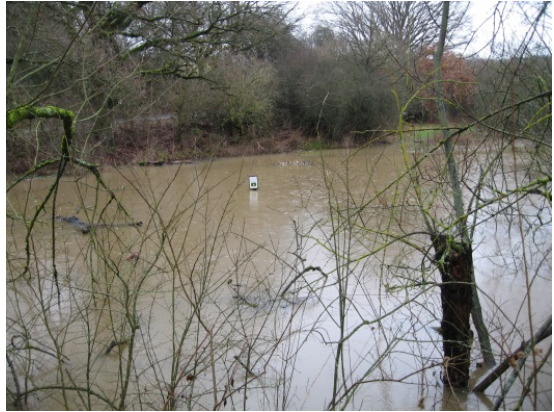
Das Jahr 2018 begann mit ergiebigen Niederschlägen, die sich in unseren Schutzgebieten besonders wohl fühlten...

Die NABU-Schutzgebiete im Bizzenbachtal erfüllen in der niederschlagsreichen Zeit eine wichtige Funktion, da sie viel Wasser aufnehmen können. Seitdem der Bizzenbach über die Ufer treten „darf“, nicht mehr geradlinig fließt und der NABU außerdem einige Tümpel in der Nähe angelegt hat, gab es keine Überschwemmungen mehr im Wehrheimer Wohngebiet „Stecker“.