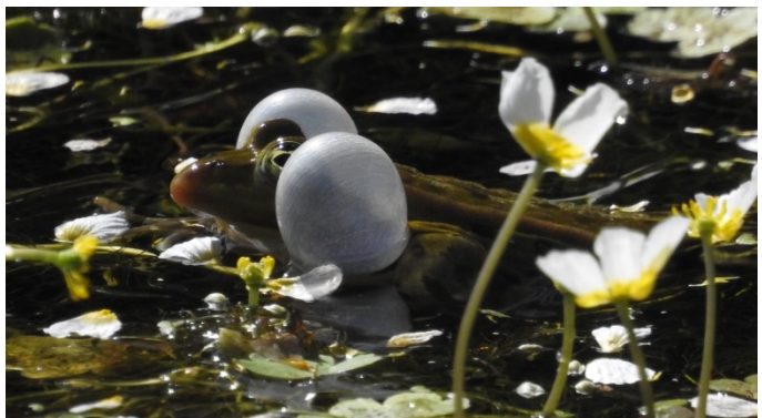
Grünfrosch mit Schallblasen im Auwiesentümpel

Auch im Jahr 2019 werden wir wieder zwei Naturschutz-Sonntagswanderungen anbieten. Der Termin im Frühjahr steht schon fest: Am 26. Mai werden wir durch das Bizzenbachtal laufen. Kommen Sie doch mit!