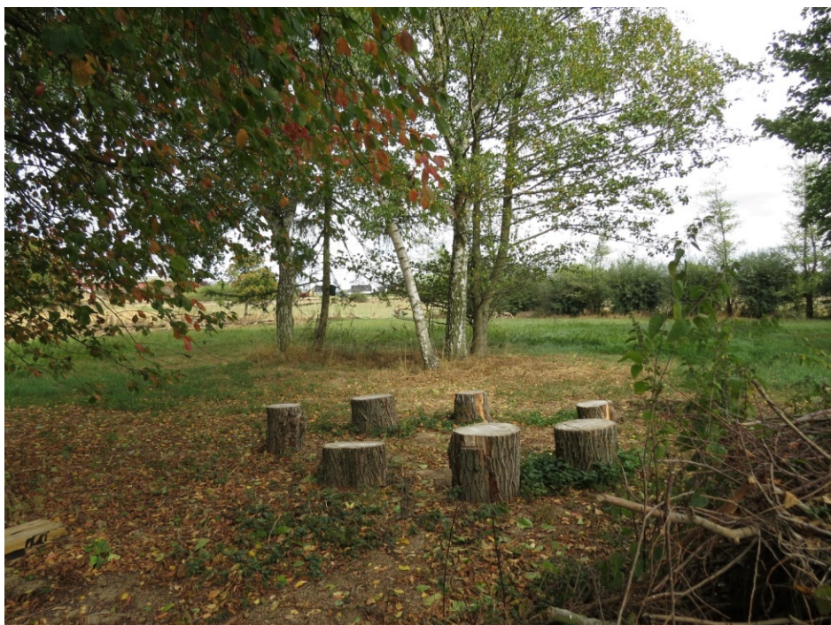
Unsere Sitzgruppe, schon viel genutzt z. B. für das verdiente Feierabendbier nach der Samstagsarbeit.