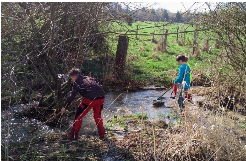
Matschen am Wasser darf natürlich nicht zu kurz kommen! Vor allem die Jungs sind früher oder später mit Sicherheit dort zu finden.