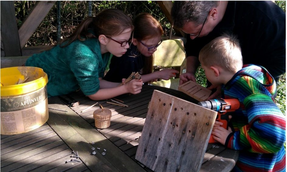
Ein Kasten mit Plexiglasröhren, in denen das Nistgeschehen der Wildbienen beobachtet werden kann, zieht die ganze Aufmerksamkeit der NAJUs an.

April: Frühjahrsputz auf der Binsenwiese: Der Zulauf wurde von Gestrüch befreit, die Nistwand für Wildbienen erweitert und neugierig untersucht. Abseits vom hektischen Treiben der Ortschaft - eine perfekte Idylle in der Natur mit 100 % Genuss und Spielcharakter.