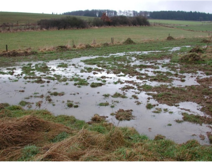
Auch die Wiesenflächen der renaturierten Aue nehmen einen großen Teil von Schwallwasser auf und bremsen so eine Hochwasserwelle