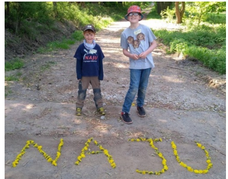
...und sogar die Blüten werden noch verwertet. Fineas hatte eine Idee!