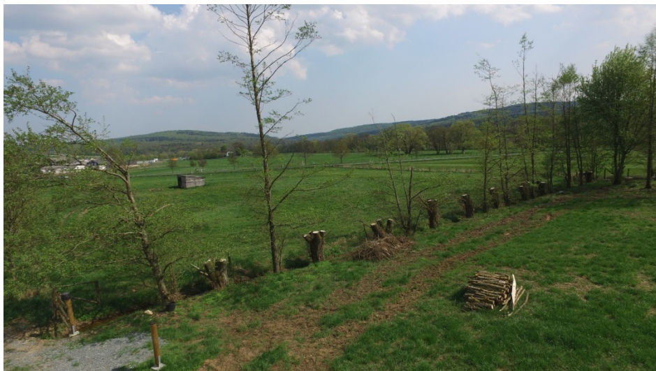
Nach dem Schnitt sahen die Bäume zunächst etwas trostlos aus....