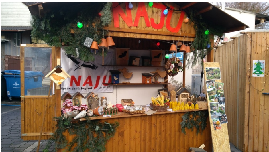
Grande Finale: Der Weihnachtsmarktstand mit stündlich wechselnder Verkaufsbesetzung.

Und so ging ein erfolgreiches Jahr zu Ende. Ich freue mich über die gute Resonanz und blicke erwartungsvoll in 2019.