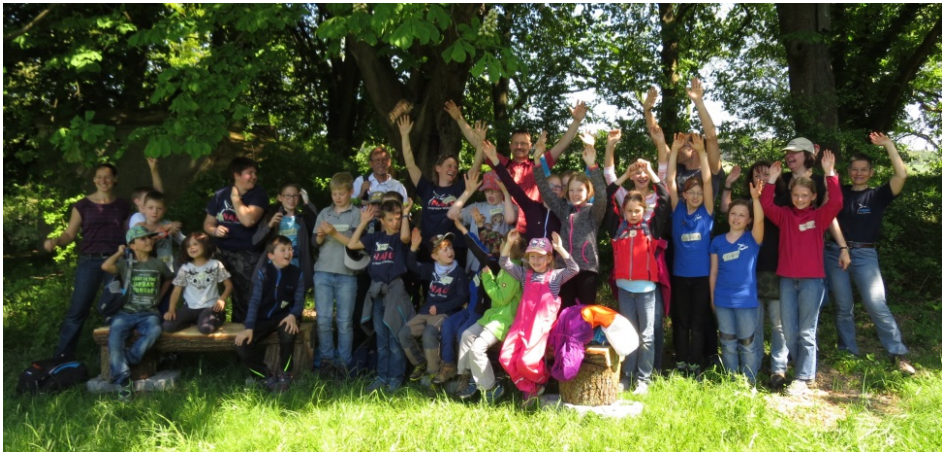
Die ganze Bande der NAJU Wehrheim und Friedrichsdorf nach der vollbrachten Aktion!

Juni: Eine weitere traditionelle Aktion ist der Wehrheimer GEO-Tag. Ein Anziehungspunkt für Groß und Klein. Jutta bereitet jedes Jahr sehr liebevoll ein Kinderquiz vor, mit dem die Kids dann entlang der Rundwege auf Artensuche gehen.