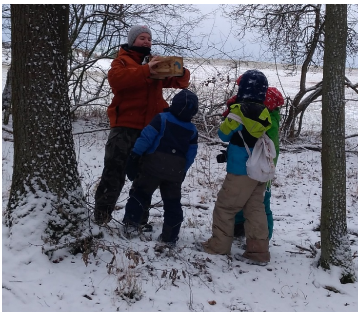
Jeder Kasten ist markiert, wer erkennt seinen selbst gebauten Kasten wieder?

Hierzu brachen wir bei klirrender Kälte auf und kämpften uns über den windigen Hügel. Zum Schluss halfen nur noch Laufspiele, um warm zu bleiben/werden.