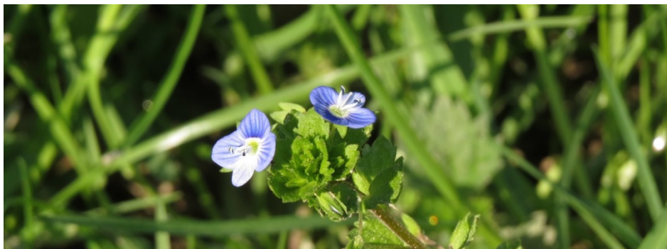
Gamander-Ehrenpreis (April 2018)