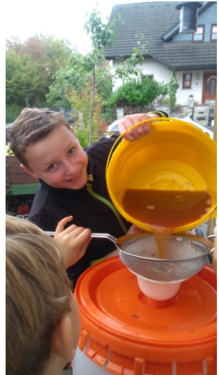
Bei mir im Hof wurde gekeltert. Viele Hände schnippelten, pressten und genossen den frischen Süßen.