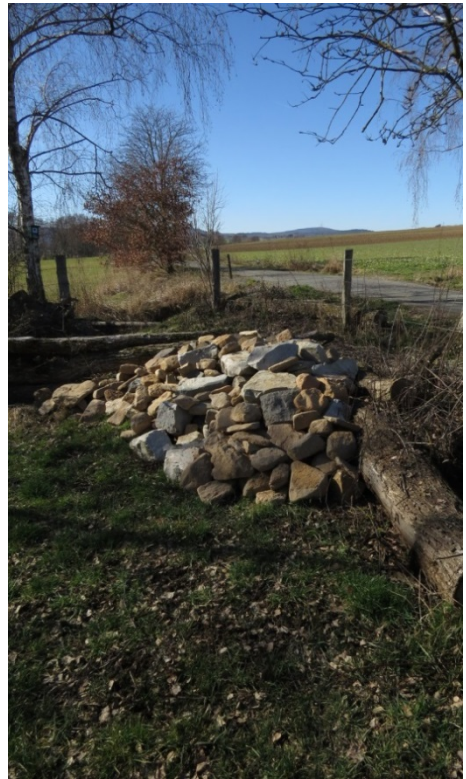
...und Steinhäufen angelegt