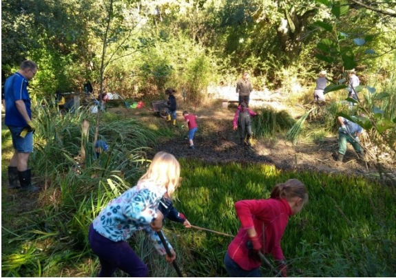
Viele Kids mit demselben Ziel!

Die große Trockenheit 2018 wurde ausgenutzt, um den großen Tümpel auf den Auwiesen zu entkrauten. Bewaffnet mit Wathose und Vierzink wurden die Krebschere und das Schilf aus dem Tümpel gezogen. Knietief im Matsch, wenn das keinen Spaß macht!