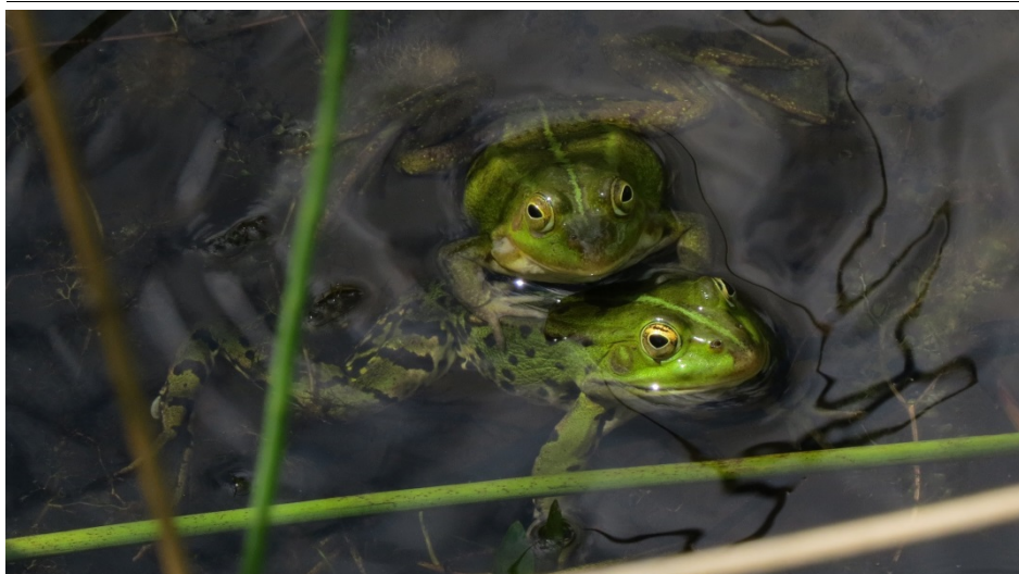
Grünfrösche im Auwiesentümpel (Juni 2018)

Ausgabe: März 2019 (erscheint 1 x jährlich)