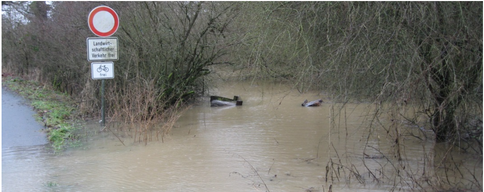
Der Auwiesentümpel war „ein wenig“ über die Ufer getreten und hat unsere Bänke neu platziert...