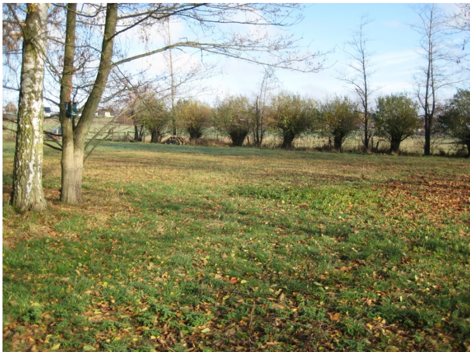
...aber der kräftige Austrieb bereits im ersten Jahr nach dem Schnitt zeigt, dass daraus einmal prächtige Kopfweiden werden.