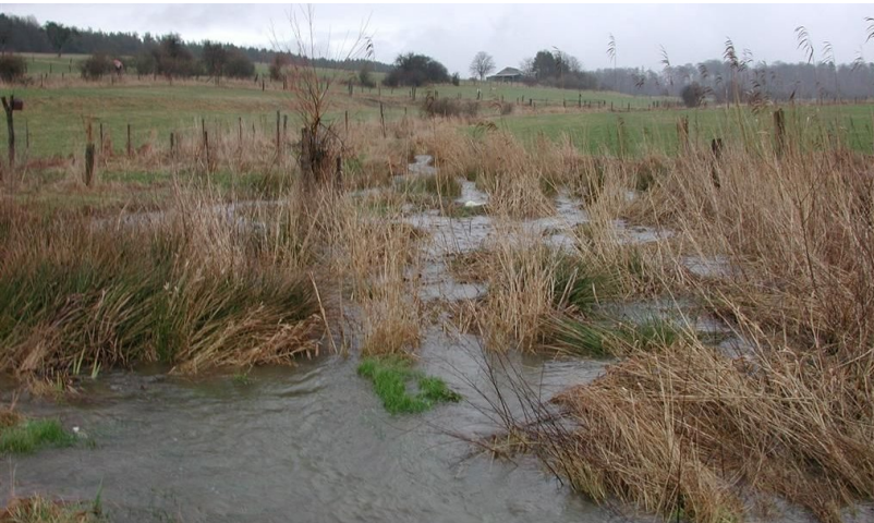
Auch hier bremst der Schilfbewuchs den schnellen Abfluss, der Bach geht in die Breite.