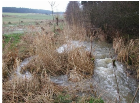
Das breitere Bachbett kann wesentlich mehr Wasser aufnehmen als das schmale in der Vergangenheit.