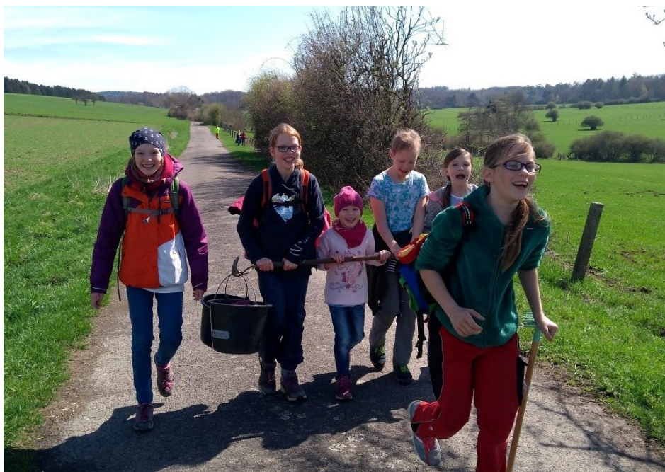
Fröhliche Mädelsrunde! Nach getaner Arbeit geht es singend nach Hause.