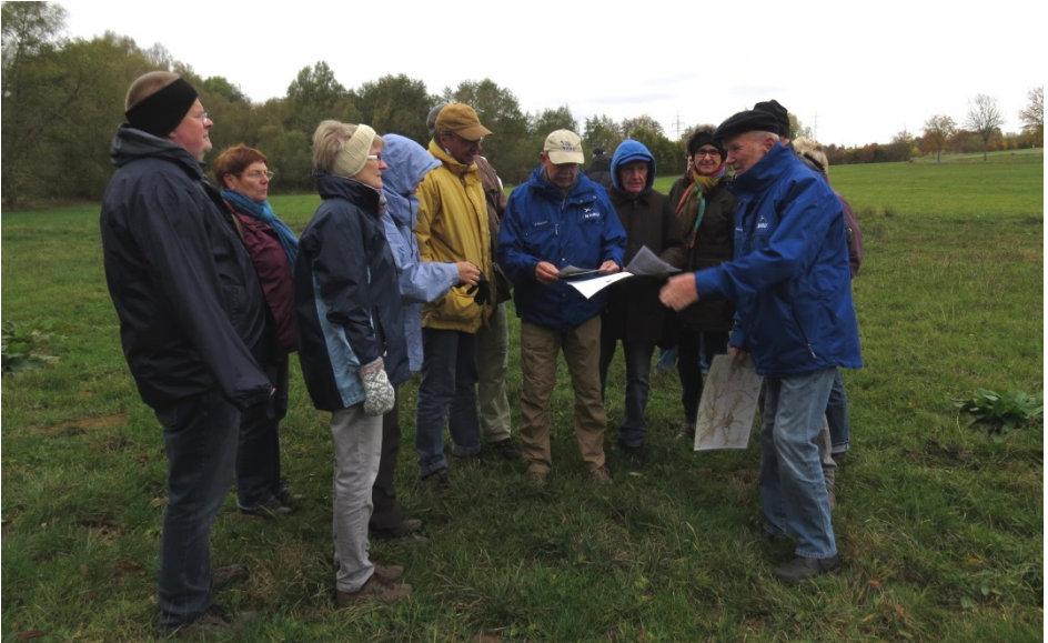
Auf unserem Grundstück „Erlenbachaue Wolfskehl“ erläuterten die NABU-Aktiven die Renaturierungsmaßnahmen, die am Erlenbach durchgeführt wurden.

Insbesondere in den beiden Schutzgebieten „Feldgehölz Wolfskehl“ und „Erlenbachaue Wolfskehl“ ist im Jahr 2018 einiges für den Naturschutz getan worden. Diese beiden Gebiete sowie die Schutzgebiete „Weltes“, „Saalborn“ und „Oberweltes“ wurden bei dem zweistündigen Rundgang am 28. Oktober 2018 vorgestellt.