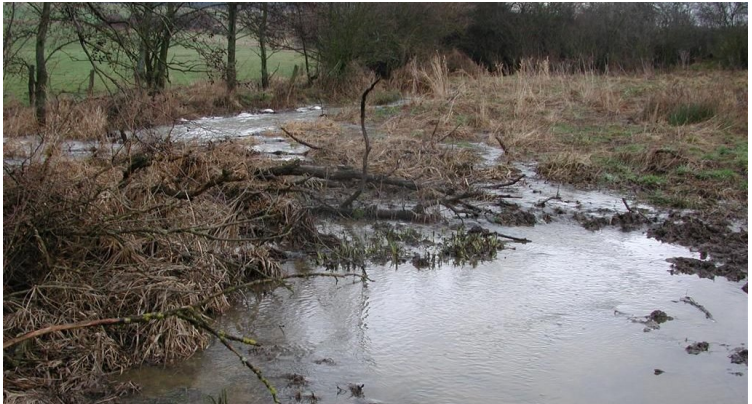
Hier verzweigt sich der Bach und flutet eine Biotopfläche.